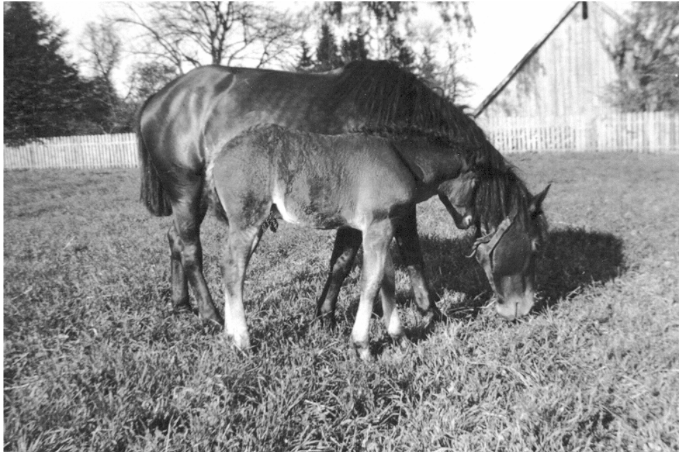
Die Fohlenkoppel am Hof