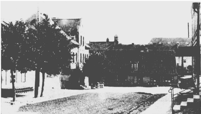
Geburtshaus des Kunstmalers Lovis Corinth querstehend am Ende der Straße

Die Stadt ließ an seinem Geburtshaus eine entsprechende Tafel anbringen und ernannte ihn zu ihrem Ehrenbürger. Der Ehrenbürgerbrief wird in Berlin von der Akademie der Künste aufbewahrt.