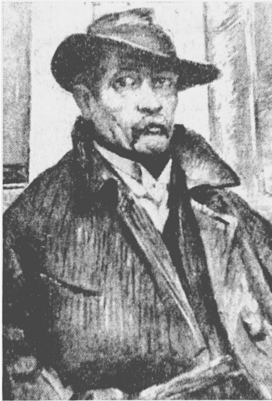
Prof. Lovis Corinth, Selbstbildnis

Mit 14 Jahren verlor er 1873 seine Mutter, die auf dem alten Kirchhof ihre letzte Ruhe fand. Sein Vater starb am 10. Januar 1889 in Königsberg und ist auf dem Tragheimer Friedhof beerdigt. In Königsberg besuchte er das Kneiphöfische Gymnasium und behauptet von sich, kein guter Schüler gewesen zu sein. Aber die lateinischen und griechischen Kenntnisse hätten ihm beim Komponieren seiner mythologischen Bilder geholfen. Als Schüler wohnte er bei seiner Tante in der Magisterstraße 42 in einem kleinen Giebelhaus.